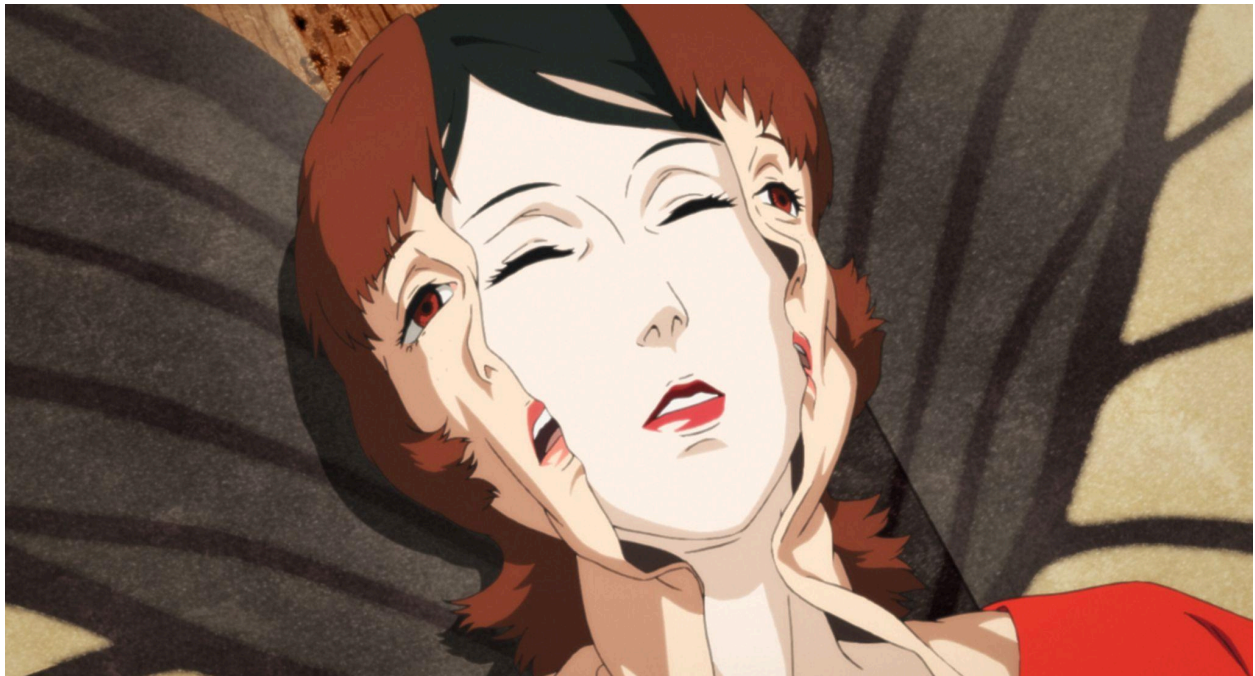
Paprika - Satoshi Kon

Dvadsaťročná kultovka Paprika od Satoshiho Kona, ktorá inšpirovala napríklad aj hollywoodsky film Počiatok , dokonale zapadá do festivalového programu. Zaoberá sa témami ako prepadávanie rôznymi úrovňami reality, spochybňovanie poznaného, nekonečná maska, snovosť a ovládanie mysle. Predstavte si, že by existovalo revolučné zariadenie, ktoré by vedcom umožňovalo vstúpiť do vašich snov a zaznamenávať ich. Tento ohromujúci príbeh jednoducho musíte vidieť.